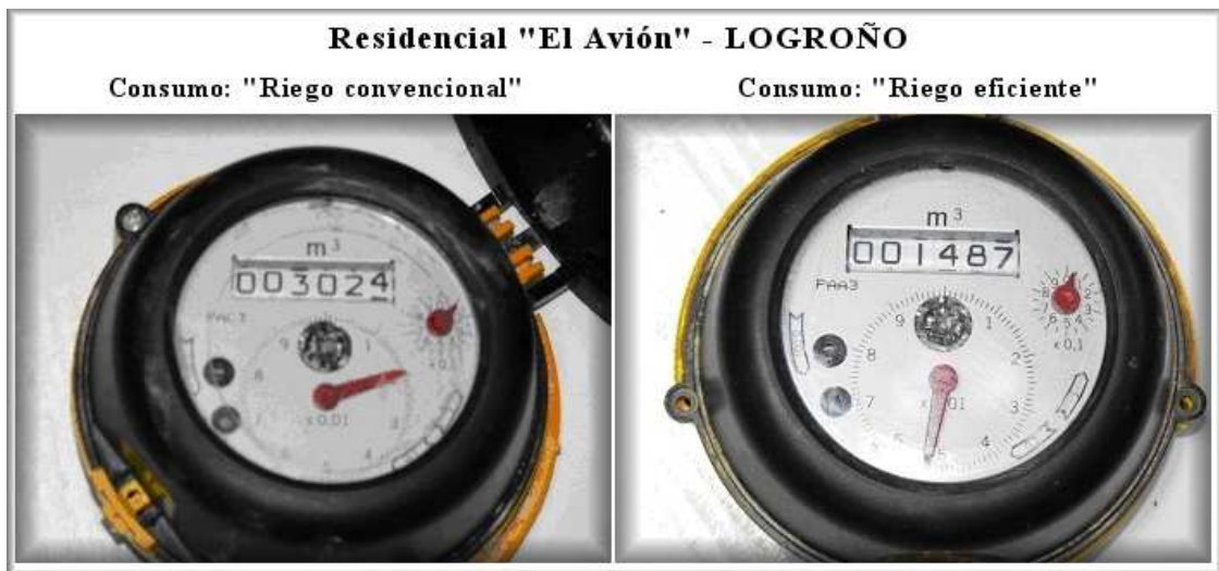
Impresión digital valor contadores –Residencial El Avión-

Resultado de datos registrados en la actuación –Residencial El Avión-